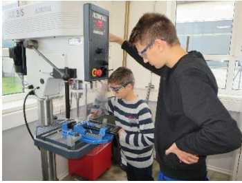
Bildunterschrift 1: Mit der Ständerbohrmaschine fällt Metallbearbeitung leicht.