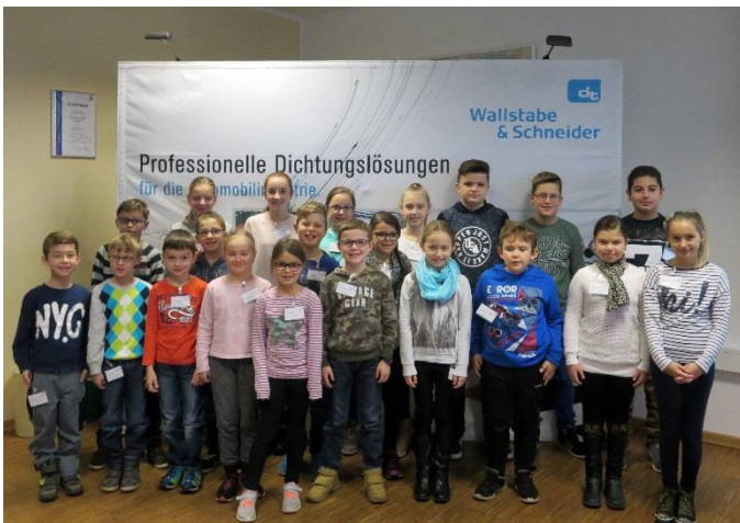
Bildunterschrift 3: 21 Kinder zwischen sechs und zwölf Jahren nutzten die Kinderbetreuung bei Wallstabe & Schneider am unterrichtsfreien Buß- und Betttag.

***ca. 1.620 Zeichen, Abdruck frei, Belegexemplar erbeten***